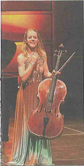
etta, violoncelle.