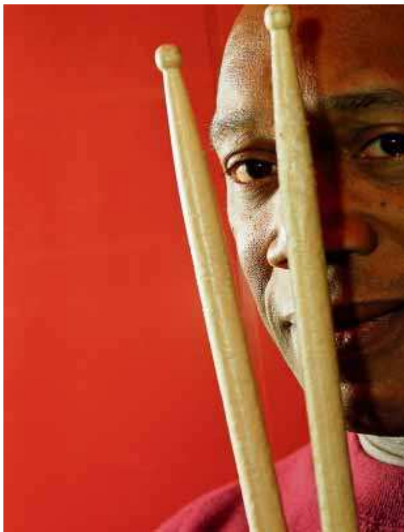
Echternach va battre la mesure avec le fameux batteur Billy Cobham.

LUXEMBOURG Mumm Séis Atelier - Luxembourg. Samedi à 20 h. Dimanche à 16 et 20 h.