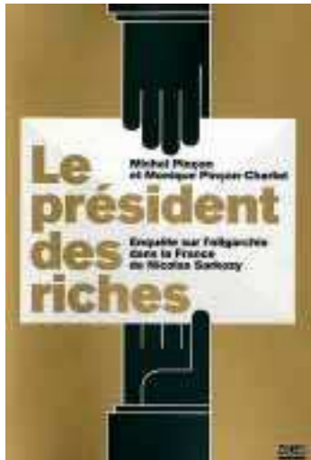
Essai. Le Président des riches , de Michel Pinçon et Monique Pinçon-Charlot. Éditeur : Zones.