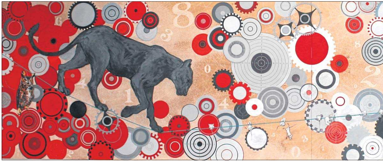
«Les maîtres du jeu» de Fernand Bertemes. (Acrylique et crayon sur bois / 150 x 620 cm)

10, rue Jean Monnet. Besichtigung mit Führung, Dauer: 30 minutes/30 Minuten. Führungen: 14, 16 und 18 Uhr. Kunst hautnah - Schauen Sie Künstlern über die Schulter. Bastelatelier für Kinder. Künstler-Café auf der Dachterrasse.