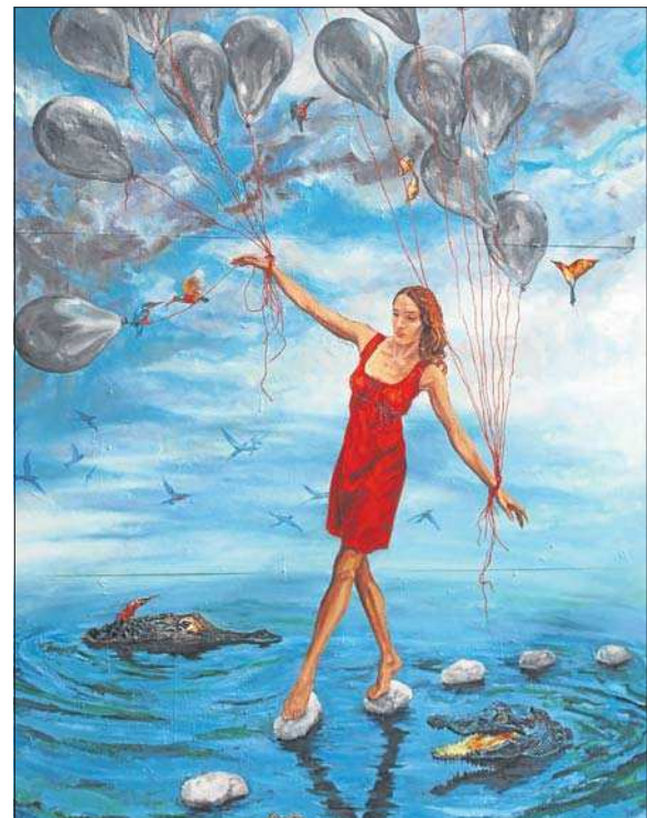
Fernand Bertemes: «A Question of Balance» (Huile sur bois / 366 x 250 cm). (PHOTOS: FERNAND BERTEMES/ALLEN & OVERY)

Pour cette quatrième édition, le rendez-vous est proposé un dimanche, le 26 septembre, entre 13 et 19 heures. Une journée où le public est peut-être davantage enclin à flâner que le samedi. De multiples visites guidées sont organisées tout au long d'un parcours qui réunit 12 partenaires. A côté des visites, certains