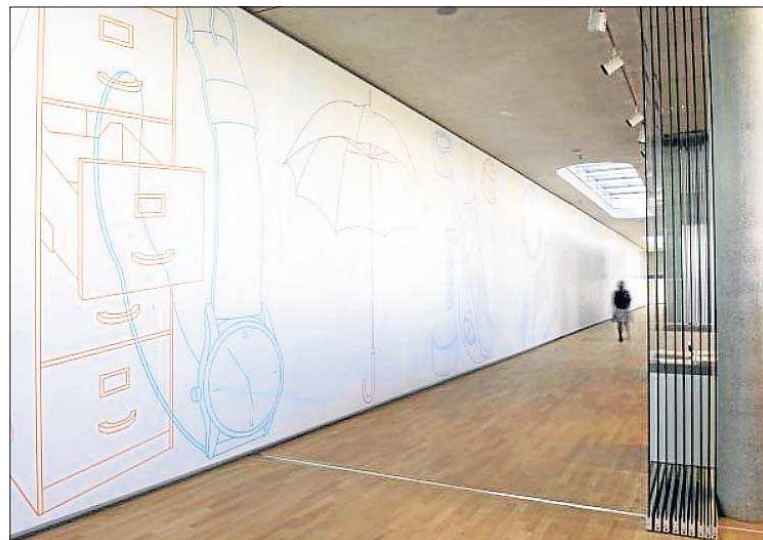
Michael Craig-Martin: «Parade».

Pour son 50 e anniversaire, la Banque a dévoilé trois œuvres d'art commandées à deux grands artistes