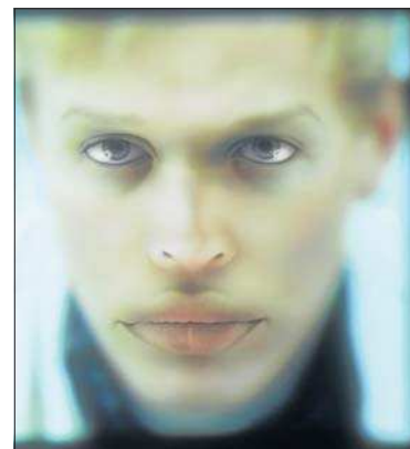
Un esprit d'ouverture.

Progressivement constituée autour du thème de la photographie contemporaine, la collection d'art de l'étude Arendt & Medernach se caractérise par son esprit d'ouverture. Ouverture d'abord par la coexistence de la collection permanente de l'étude et d'un espace d'expositions temporaires organisées par Café Crème a.s.b.l. Ouverture ensuite en ce qu'au sein de la collection, des oeuvres d'artistes confirmés côtoient celles de jeunes artistes prometteurs. Ouverture finalement par la diversité des origines des oeuvres: à