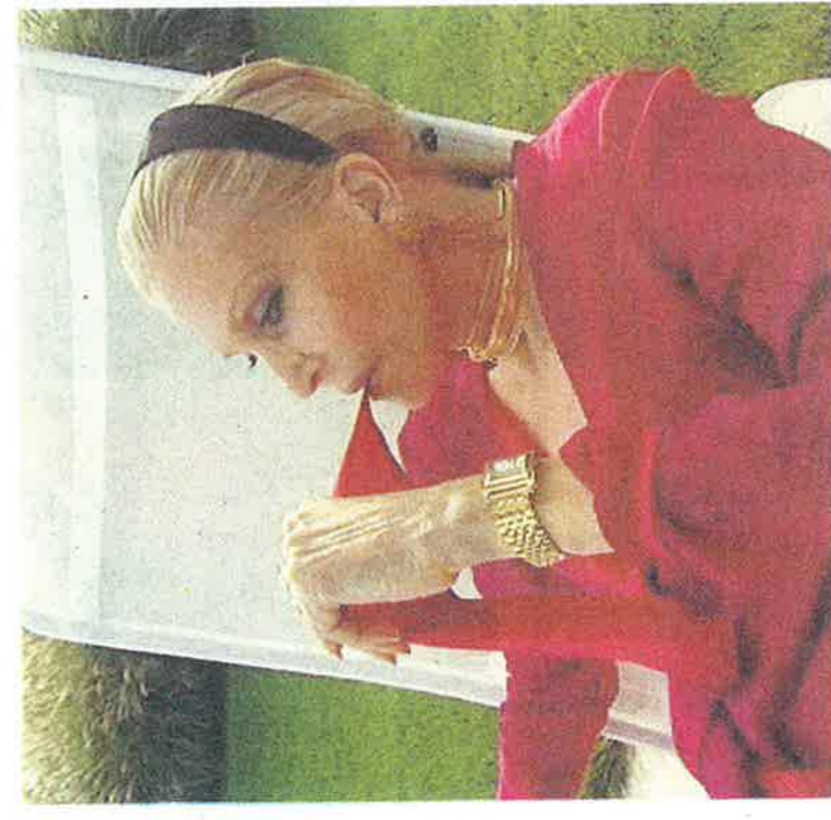
„Forever“ von Julika Rudelius

Photos: Julika Rudelius; Kneip Art Collection; David LaChapelle